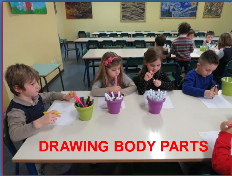
DRAWING BODY PARTS