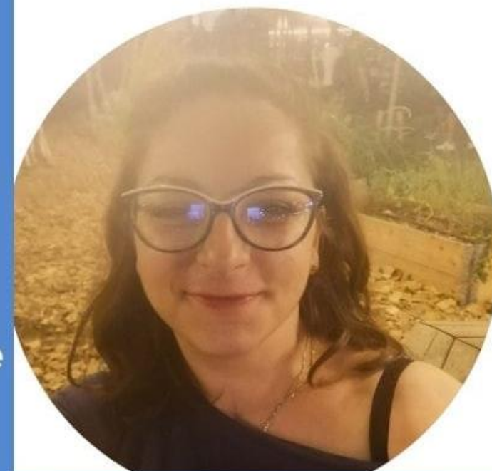
MARIAPINA BALESTRA SCUOLA SECONDARIA DI PRIMO GRADO

È necessario che la scuola riprenda la sua centralità nella società contemporanea e che riacquisti il suo valore. Noi ci impegniamo perché ciò avvenga.